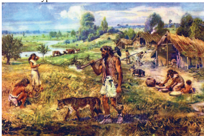
Život v mladší době kamenné

Eduard Štorch zasadil děj své knihy do mladší či pozdní doby kamenné a jako vždy do České kotliny, hlavním hrdinou udělal dospívajícího chlapce Havranpírka. Pojďme se podívat, jak svět Osady Havranů vypadal.