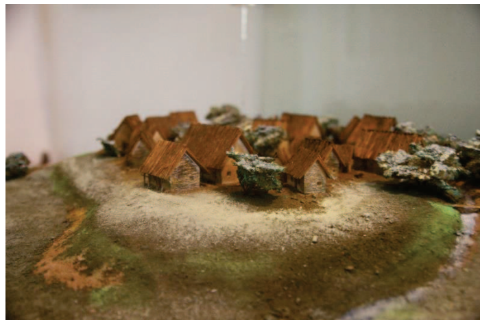
Rekonstrukce vesnice z mladší doby kamenné

Hoch přinesl ještě třísek, co mohl unést, a přiložil na oheň. Několik polen bylo již v chýši přichystáno; vystačí hořet do rána. Dým se prodíral ven střechou, spletenou z větví a přikrytou kožemi. Vypadalo to, jako by chatrč hořela. Komína ani oken nebylo. Obyvatelé všech chatrčí si tak svítivají ohněm, nebo za lepšího počasí odhrnují závěsové kožešiny u vchodu do chýší.