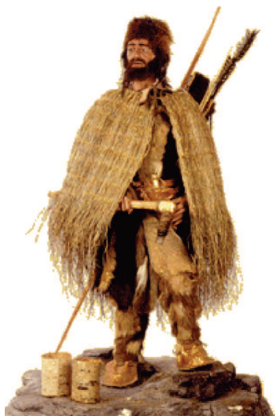
Rekonstrukce muže z pozdní doby kamenné

Náčelníkem osady byl sachem (volený rodový soudce), čaroděj v jedné osobě, vzimě oděn